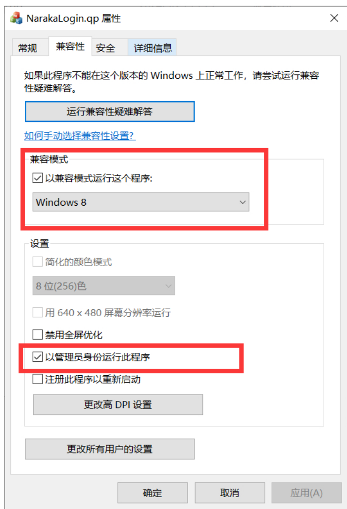
右键软件—属性兼容性设置

②我们开启辅助后F6按键一定不要按，振刀默认开启，按F6又就关闭了，有些兄弟进游戏地图跳点 F5跟随队友 F6不跟随，不自觉点F6就会关闭软件，因为我们没有菜单的原因，你不知道是开了还是关了，所以就不要按F6